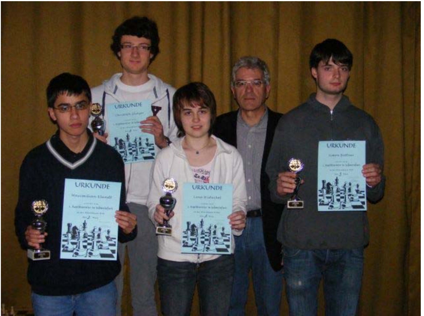
Siegerehrung u18, u18w