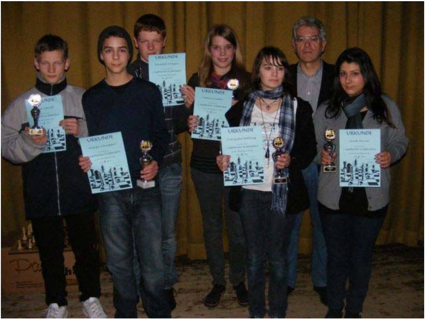
Siegerehrung u16, u16w