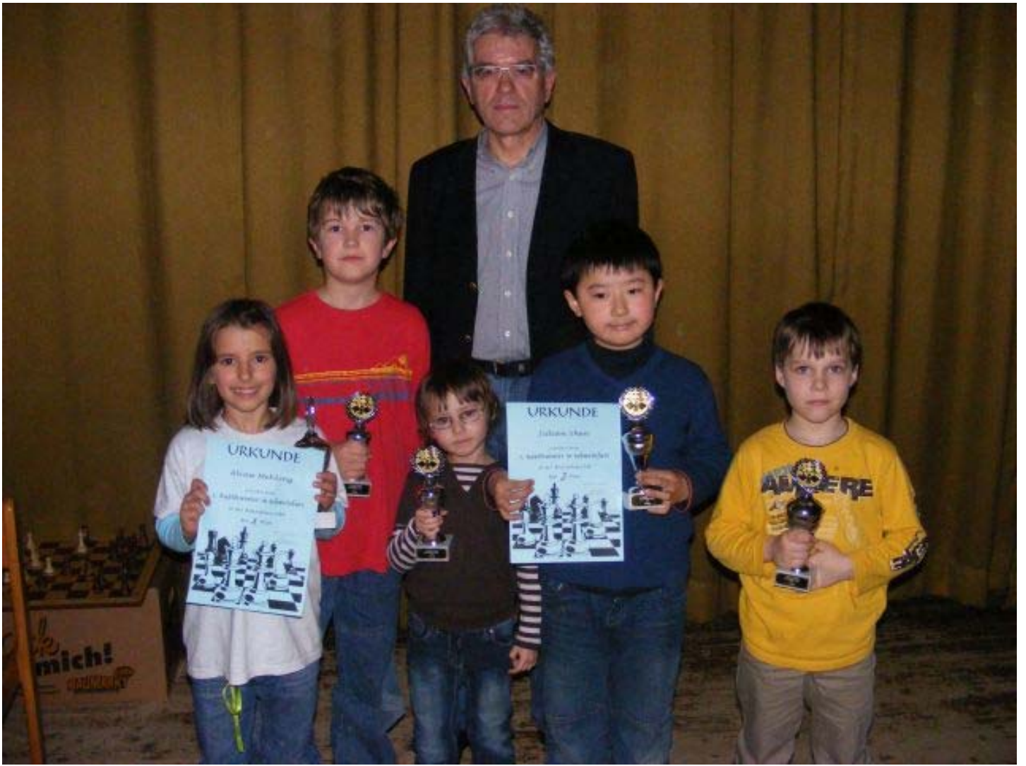
Siegerehrung u8, u8w