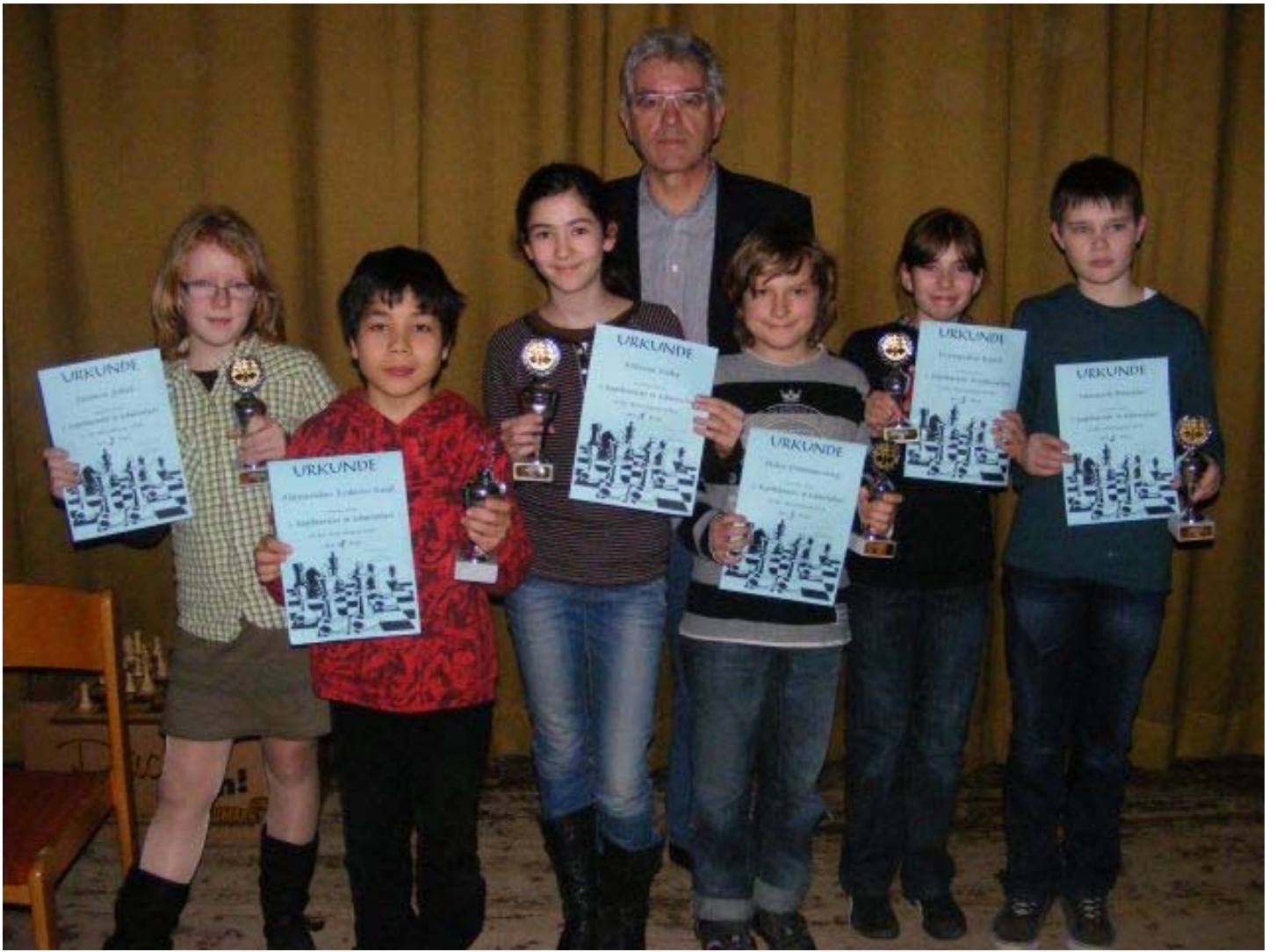
Siegerehrung u12, u12w