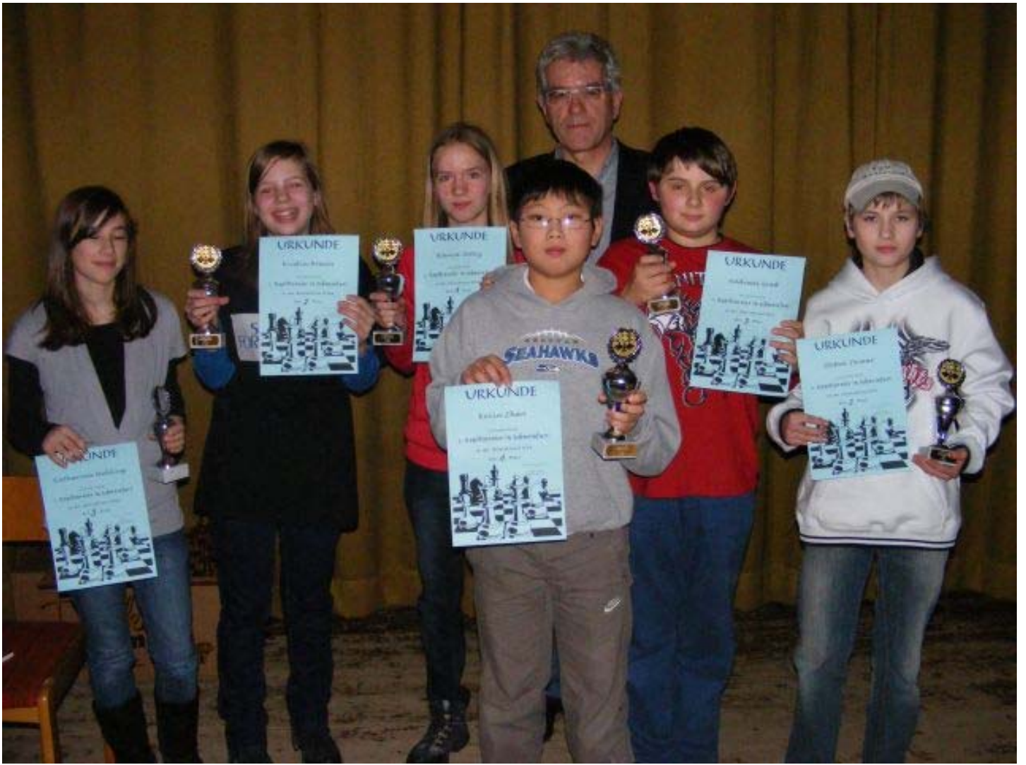
Siegerehrung u14, u14w