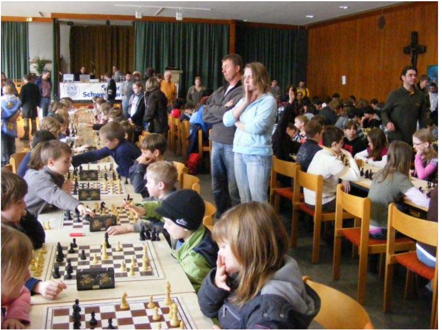
Blick in den Turniersaal von St. Michael